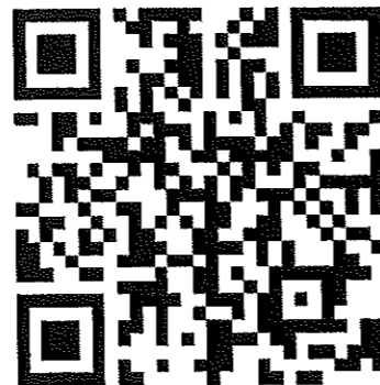
新規登録 QR コード

ログイン後、登録したお写真が画面右上に表示されます。クリックするとデジタル会員証が開きます。編集もそこから可能となります。